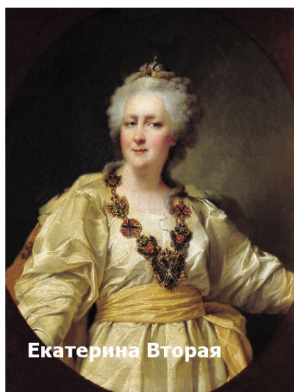
Д. Левицкий. Портрет Екатерины Второй

Прозрачность – так называлось, совершенно официально, здание, состоящее из шести этажей, шестиквартирное, каждая квартира занимала целый этаж. Сталь, бетон, затемненное стекло – почти как «Спокойствие», но с зеленоватым оттенком затемнение. Здание примыкало к восьмиэтажному отелю, построенному десятью годами ранее по стандартному проекту, без излишеств. В отеле наличествовал бар, и соединялся бар с вестибюлем Прозрачности дверью с компьютерным замком – для удобства ее, Прозрачности, обитателей. Вид с улицы – козырек над входом в отель и бар, вывеска в окне – «Каткин Бюст», над надписью улыбающееся девичье лицо, и не очень понятно, при чем тут бюст, никакого бюста на картинке нет, и что за Катка, уж не Екатерина ли Вторая. Но нет, Екатерину лицо на вывеске несколько не напоминало, и одноименных легенд кинематографа тоже.