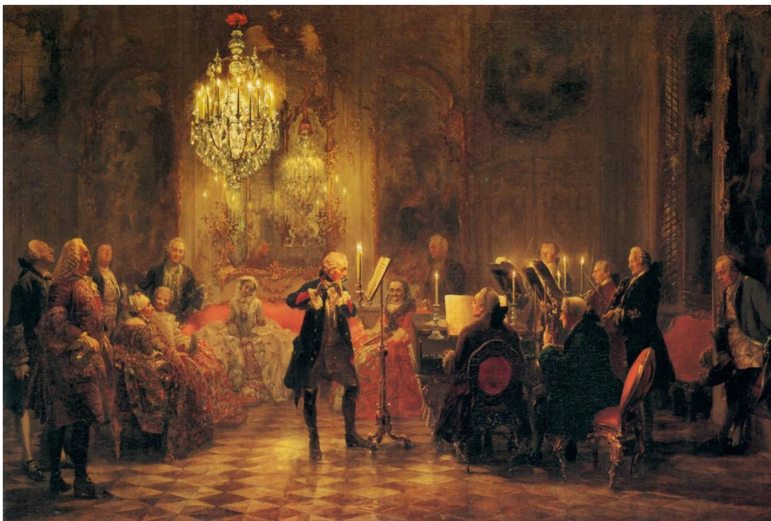
А. Менцель. Концерт для флейты с Фридрихом Великим

В углу помещался концертный рояль, увенчанный вазой и фотографией карибского, в тон пальмам, восходя в пластмассовой рамке. А также лежала на рояле стопка книг. Кто ее туда положил – неизвестно, вчера не было.