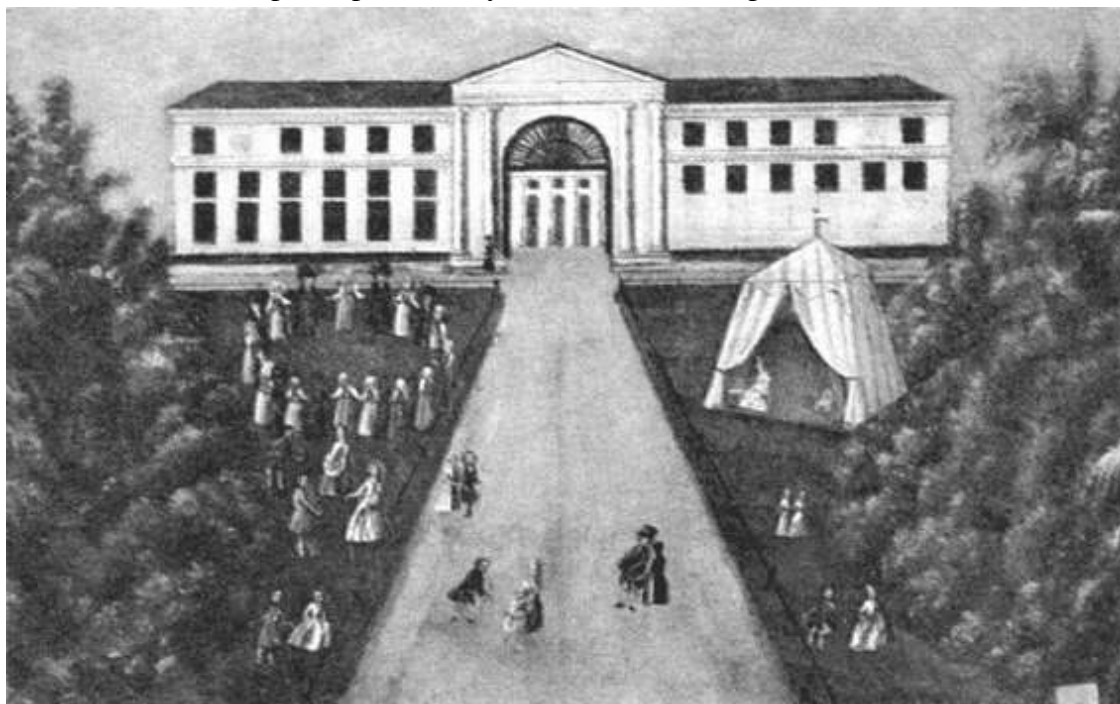
Въездная арка и придворцовые флигели. Рисунок неизвестного художника, XIX век

в произведение ландшафтного искусства. Добиться этого можно было, лишь хорошо изучив местность, что и делал Тромбара, подолгу и часто бывая в Архангельском.