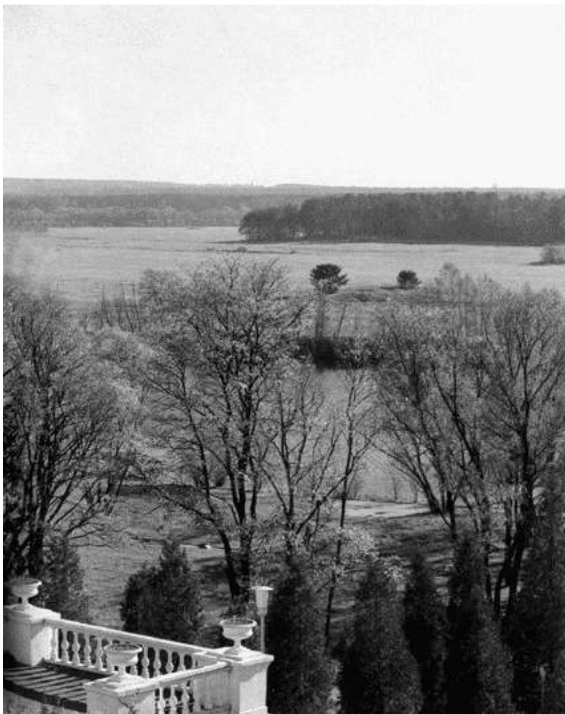
Все дороги Архангельского ведут к Москве-реке

Нынешнее Архангельское завершается там, где некогда начиналось – на обрывистом берегу Москвы-реки. Отсюда взгляду открываются заречные дали, только отсюда создается полное впечатление об ансамбле и только здесь можно осознать его колоссальный размер. Некогда с этого места княжескую усадьбу писали крепостные художники, пытаясь охватить взглядом все сразу: дворец, парк и маленькую старую церковь – единственную постройку, уцелевшую с тех времен, когда будущий дворцовый комплекс был всего лишь хозяйственной вотчиной.