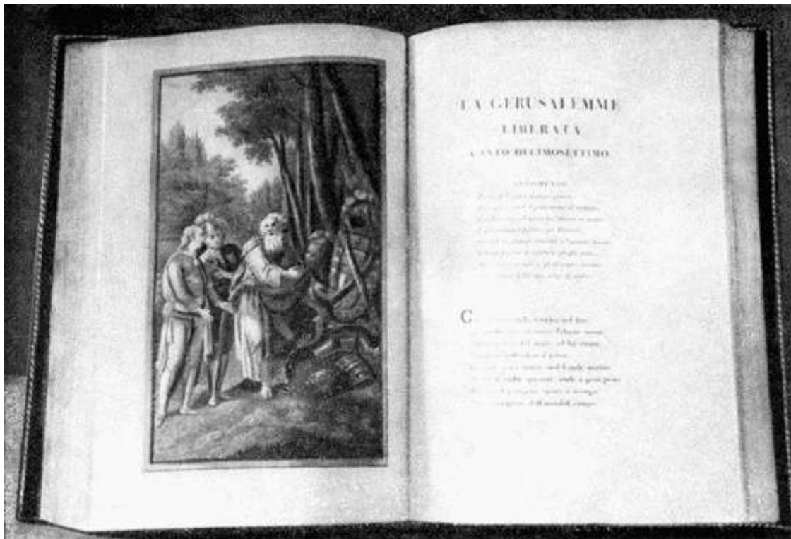
Т. Тассо. Освобожденный Иерусалим. Книга из библиотеки Архангельского

на французском языке, а самым большим был раздел художественной литературы: французские романы, пьесы, переводные сочинения античных и французских философов. Вторым по величине являлся исторический раздел: книги греческих и римских историков, огромные тома по истории европейских и отдельных восточных государств. Среди книг по искусству выделялись роскошные издания крупнейших европейских музеев, и не меньшим великолепием отличались каталоги картинных галерей и модных салонов почти всех столиц Европы.