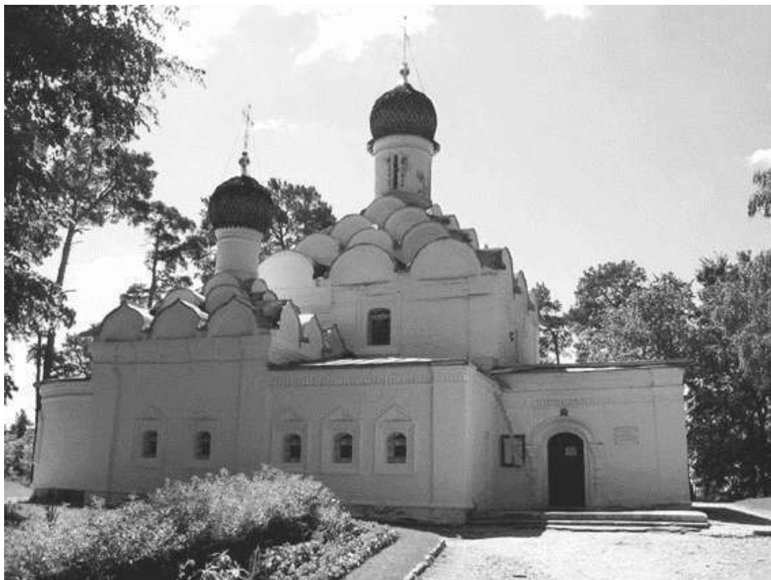
Главный фасад церкви Михаила Архангела обращен к селу и усадьбе