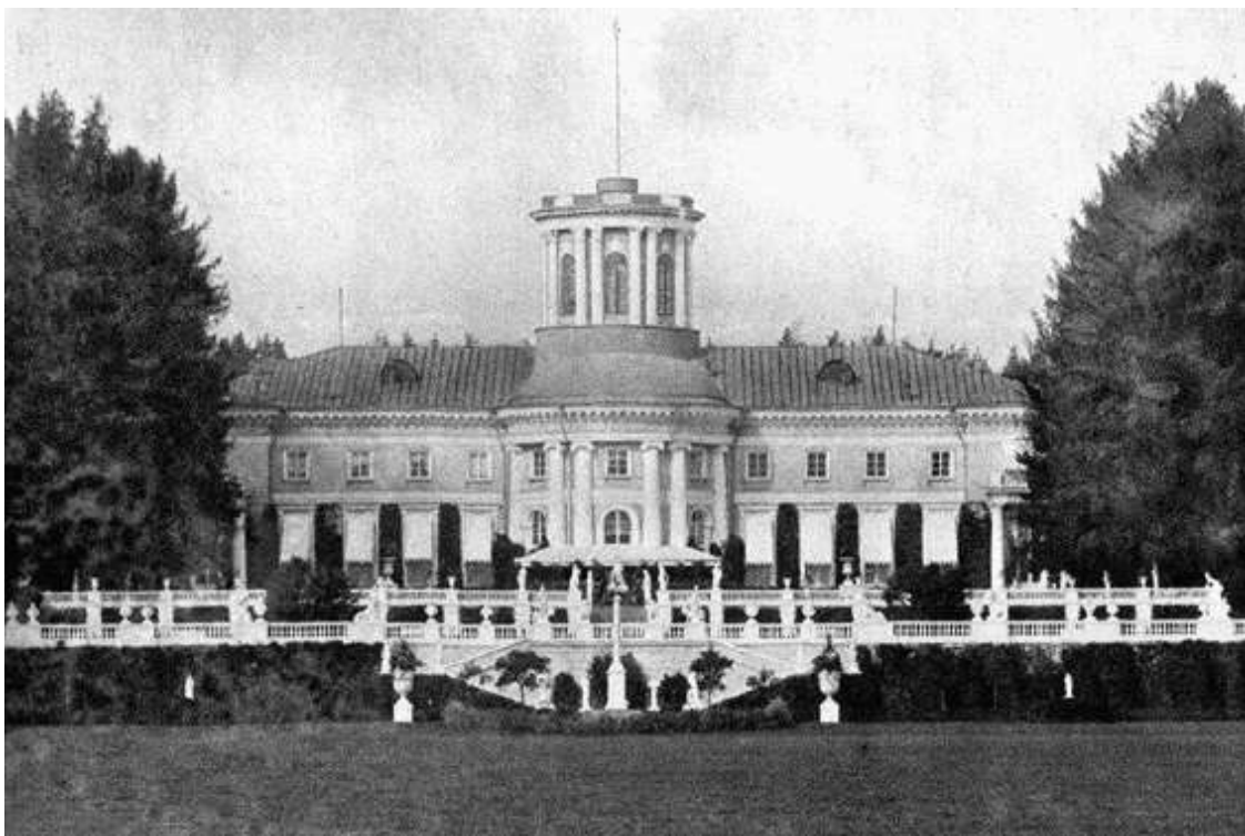
Большой дом. Фотография, конец XIX века

Вместе с Большим домом на высоком берегу Москвы-реки строились 2 тепличных павильона, законченные к 1786 году. Ни один из них до нашего времени не сохранился, однако представить, как они выглядели, позволяет рисунок крепостного художника, где оранжереи изображены вместе с ближайшим участком Большого партера, как ландшафтным искусстве называют парадную, открытую часть парка, для которой характерны геометрическое построение, строгость линий и форм. При оформлении партера в Архангельском Тромбаре не понадобилась фантазия, ведь подобные сооружения не допускали отклонения от правил: прямые аллеи, огромные засеянные травой площади, редко посаженные и подстриженные по-версальски в виде шаров деревья. Позади них возвышалась стена из старых лип с пышными кронами. Считается, что липы остались от французского сада Дмитрия Михайловича, поскольку новый хозяин хотел иметь настоящий парк сразу, не дожидаясь пока вырастут молодые деревца.