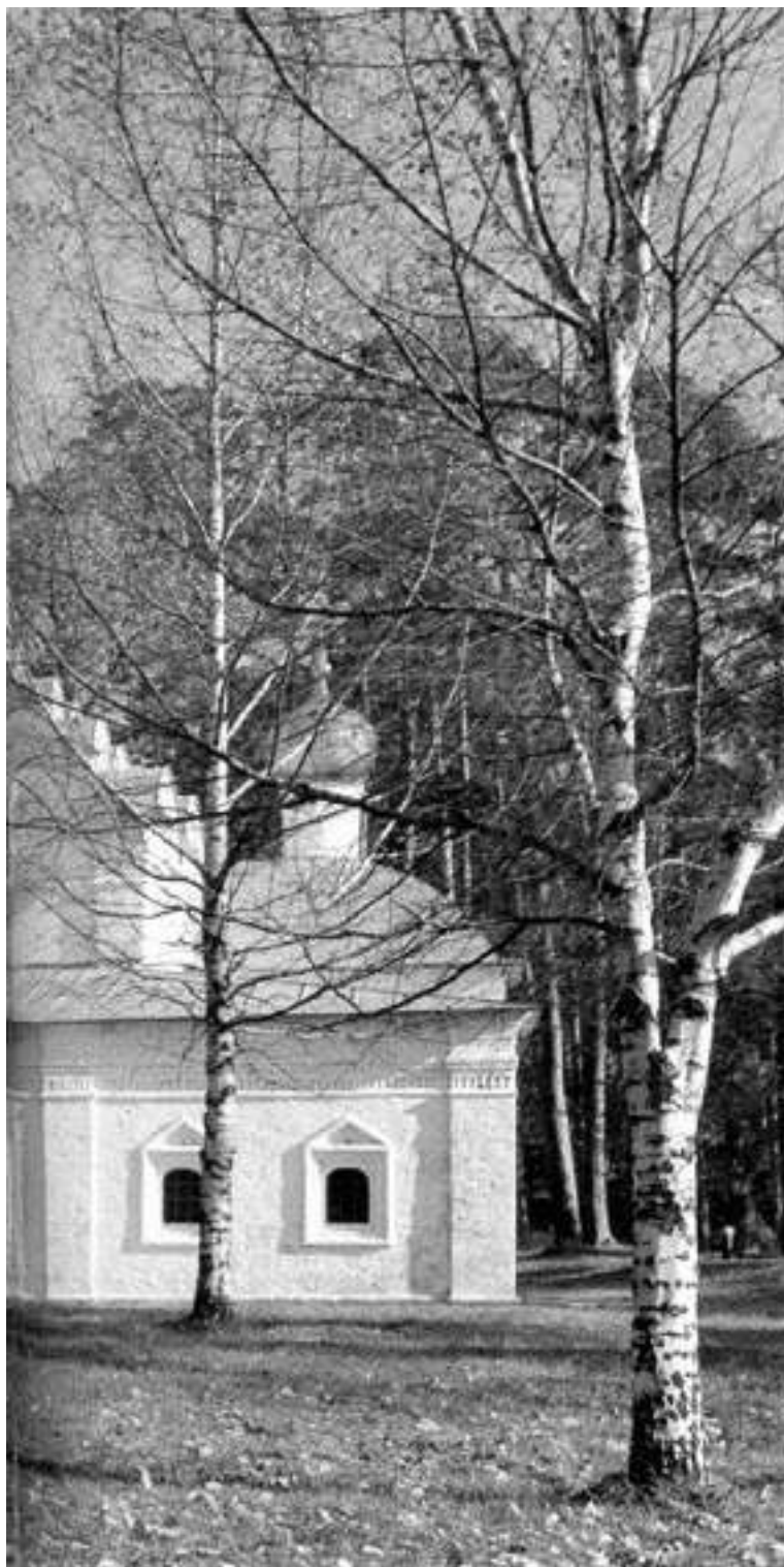
Архангельская церковь прячется за деревьями, словно стыдясь своего скромного вида