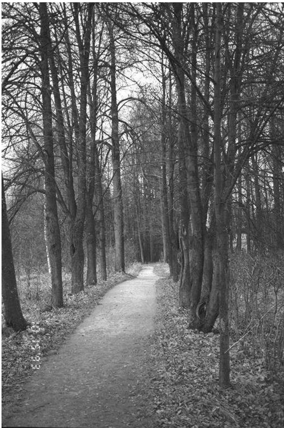
Ни один из путей в Архангельское не минует леса