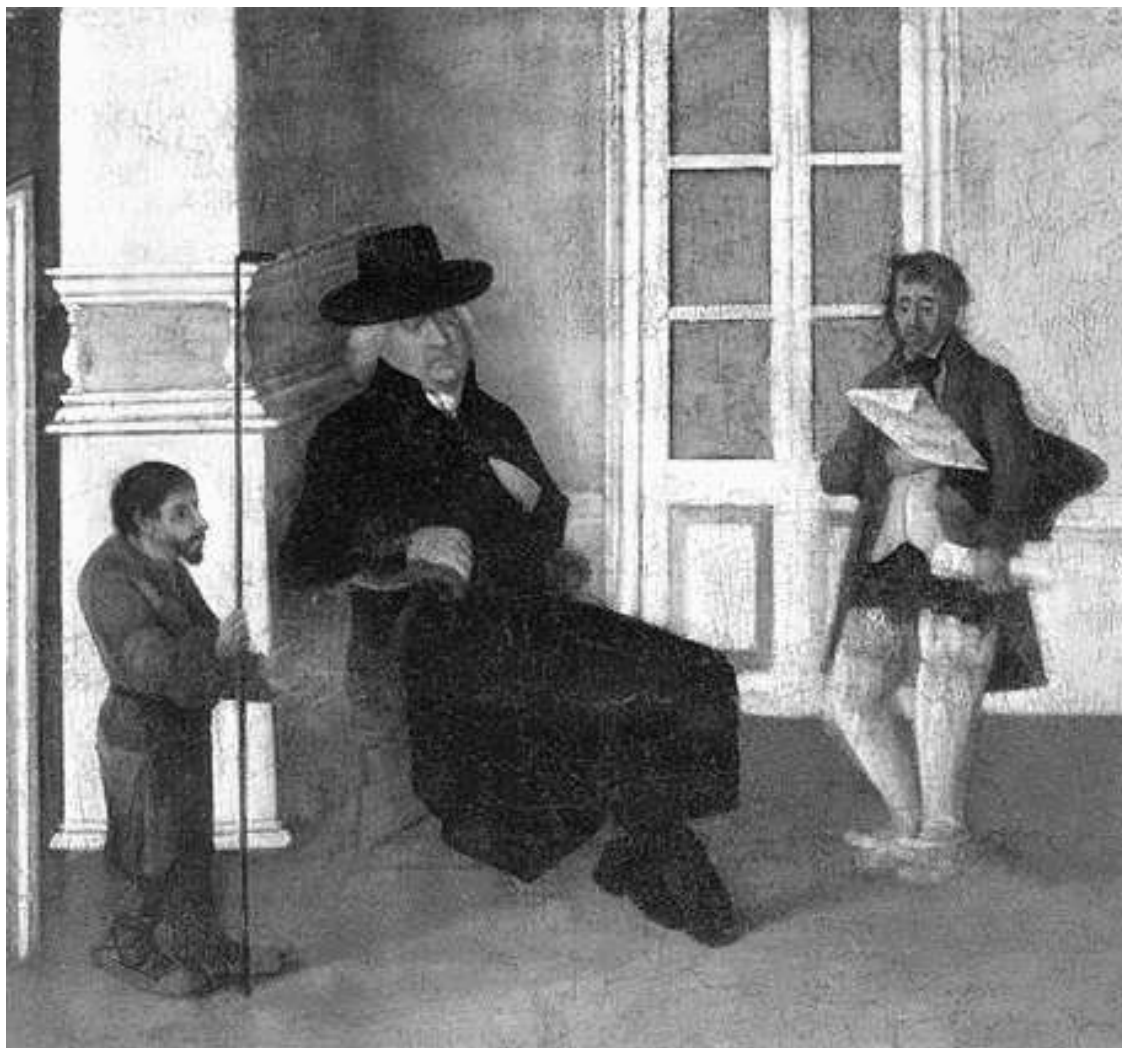
Доклад управляющего своему помещику. Картина неизвестного художника

Дмитрий Михайлович начал придворную карьеру комнатным стольником малолетнего Петра. Став царем, тот отблагодарил верного слугу чином капитана Преображенского полка и, невзирая на его семейное положение, отправил за границу «для науки воинских дел». Голицына больше интересовали дела морские, в частности навигация, которую он изучал в Италии, затем применив знания в Константинополе, где сумел добиться свободного плавания для русских судов по Чёрному морю. После дипломатической миссии в Польше и Саксонии князь управлял Белгородским разрядом (созданная в 1658 году военно-административная единица), причем в официальных бумагах его «писали» сначала воеводой, а затем губернатором. Перебравшись в Москву в качестве сенатора и президента Камер-коллегии, Голицын занимался подготовкой доклада по государственным доходам и расходам. Современники характеризовали его как человека честного, управителя неподкупного, вникавшего в каждую мелочь. Между тем, преклоняясь перед Петром, будучи верным служакой и «разумнейшим человеком своего века», Дмитрий Михайлович отвергал крутую ломку старинного уклада и, к несчастью своему, открыто сочувствовал царевичу Алексею. Обвиненный в заговоре, князь лишился чинов, а потом, уплатив немалый штраф, надолго оказался под домашним арестом.