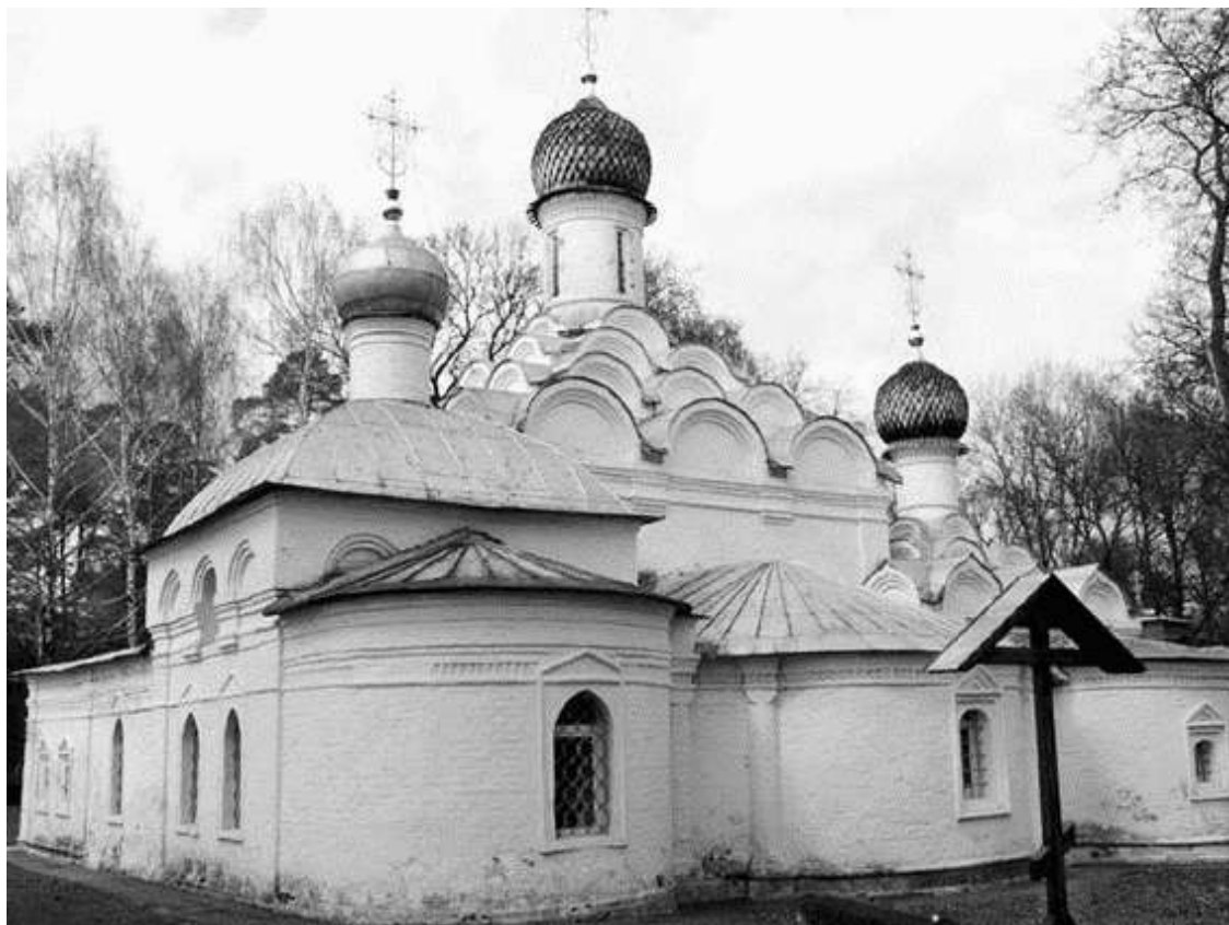
С южной стороны Михаила Архангела находится маленькое кладбище

Вначале единственный вход в храм Михаила Архангела находился с северной стороны, там, куда подходила дорога из села. Позже здание было перестроено по канонам классицизма и, к сожалению, утратило свою оригинальную композицию. Позднейшие строители, не искусные в архитектурном искусстве, неловко расширили окна, переложили полы, снесли тесовую кровлю, заменив ее железной. Под банальной четырехскатной крышей спрятали очаровательные кокошники – за ними якобы некому было ухаживать. Тогда же снесли маленькую звонницу над западной стеной, а вместо нее возвели колокольню, сначала деревянную, а потом каменную, трехъярусную, с часами и шпилем.