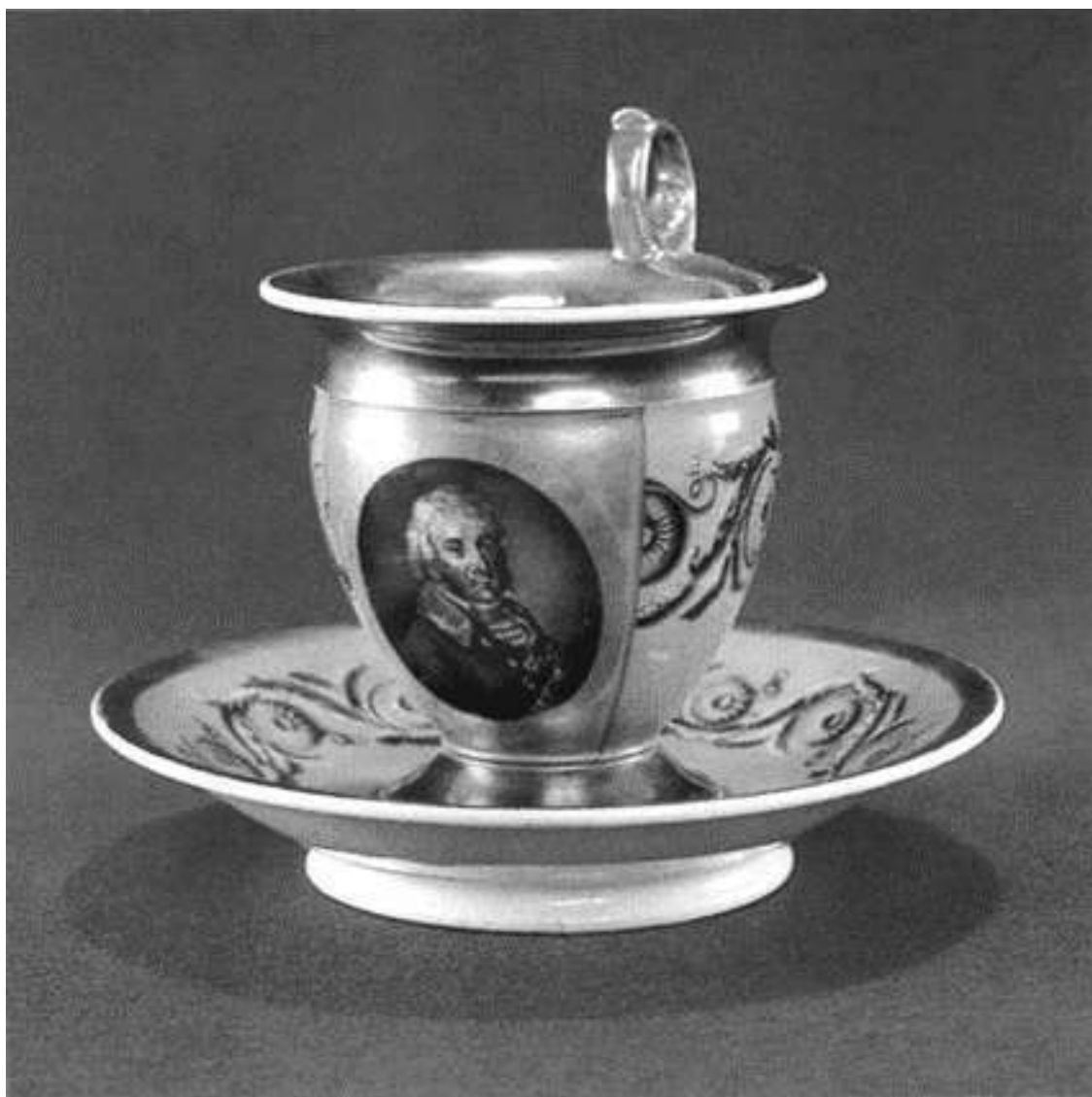
Чайная пара с портретом Николая Алексеевича Голицына. Фарфор из фондов музея-усадьбы «Архангельское»

Думал ли Николай Алексеевич, видевший Париж (а кроме него, Страсбург, Вена, Милан, Турин), о французских королях или нет, но планы его потрясли размахом. Он задумал величественный ансамбль, начав с того, что раскрыл свой дорожный журнал и записал деньги, израсходованные 3 сентября 1780 года, «на букет, извозчика, карточный долг, план Архангельского», за который архитектор де Герн получил 1200 рублей. Тот проект вместе с датой и подписями обеих сторон в полной сохранности дошел до наших дней, в отличие от сведений об авторе. О нем не известно почти ничего, кроме того, что он был немолодым французом и хорошим специалистом с дипломом и премией парижской Школы изящных искусств. Скорее всего, он не приезжал в Россию, и его вклад в Архангельское ограничился планом дворца, или Большого дома, как называл свою новую резиденцию Голицын. Проект парка и всего, что к нему относилось, принадлежал итальянцу Джакомо Тромбара. Он жил в России постоянно и, помимо звания члена Академии художеств и должности придворного зодчего, имел много знакомых среди столичной знати, в числе которых был и Николай Алексеевич. Именно Тромбара предложил разбить в усадьбе парк с террасами и новыми оранжереями, воплотив замысел с итальянским мастерством и русским размахом. Благодаря ему корявый склон превратился