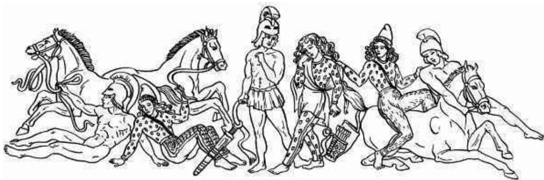
Эллины и амазонки