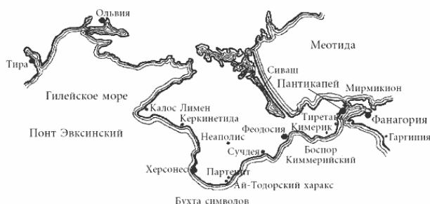
Карта древнего Крыма

В силу природных и географических особенностей Крым стал своеобразным местом встречи различных культур. В разные времена его населяли эллины, иранцы, иудеи, скифы, генуэзцы, армяне, татары, русские. Античные авторы называли «большой и весьма замечательный» полуостров Таврикой по общему наименованию племен, обитавших в Крыму до прихода кочевников из среднеазиатских степей.