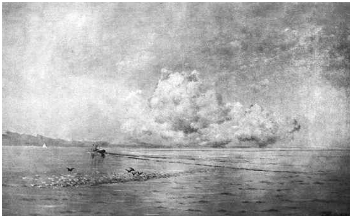
И. К. Айвазовский. «Штиль у крымских берегов», 1899

В обстановке вечного страха перед врагом исконным жителям Крыма защитой служили горы. Впрочем, они сумели устроиться в неприступных скалах настолько удобно, что решились спуститься в долины только в середине XIX века. К тому времени некогда дикий полуостров превратился в удобное и вполне цивилизованное место отдыха русской аристократии.