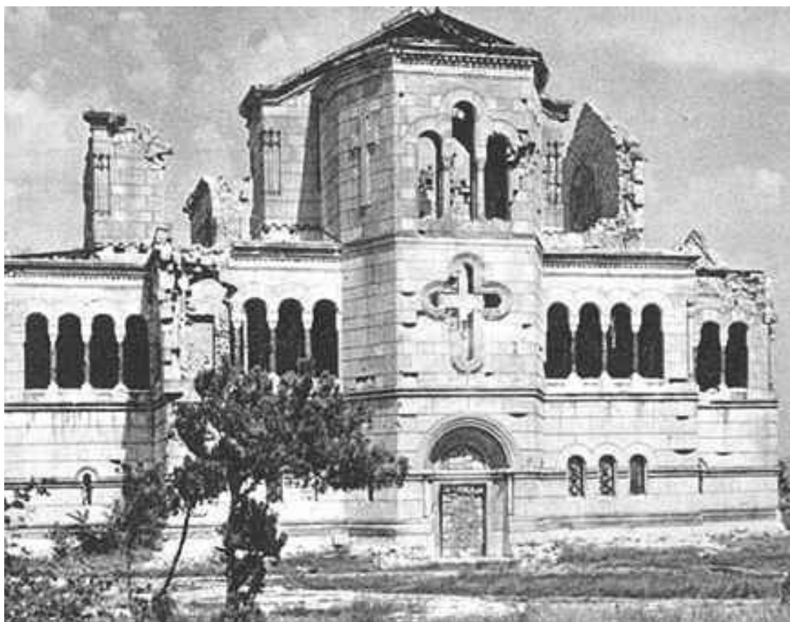
Собор Святого Владимира

В первой половине XIII века Причерноморье захватили турки-сельджуки. В 1223 году первый набег на полуостров совершили орды хана Батыея, и Херсонес фактически оказался наедине с врагом. Стремительно теряя влияние, город начал уступать генуэзцам, сумевшим переместить главные торговые пути в свои владения. Итальянские торговцы контролировали город, но вернуть ему былое могущество не смогли даже с помощью населения.