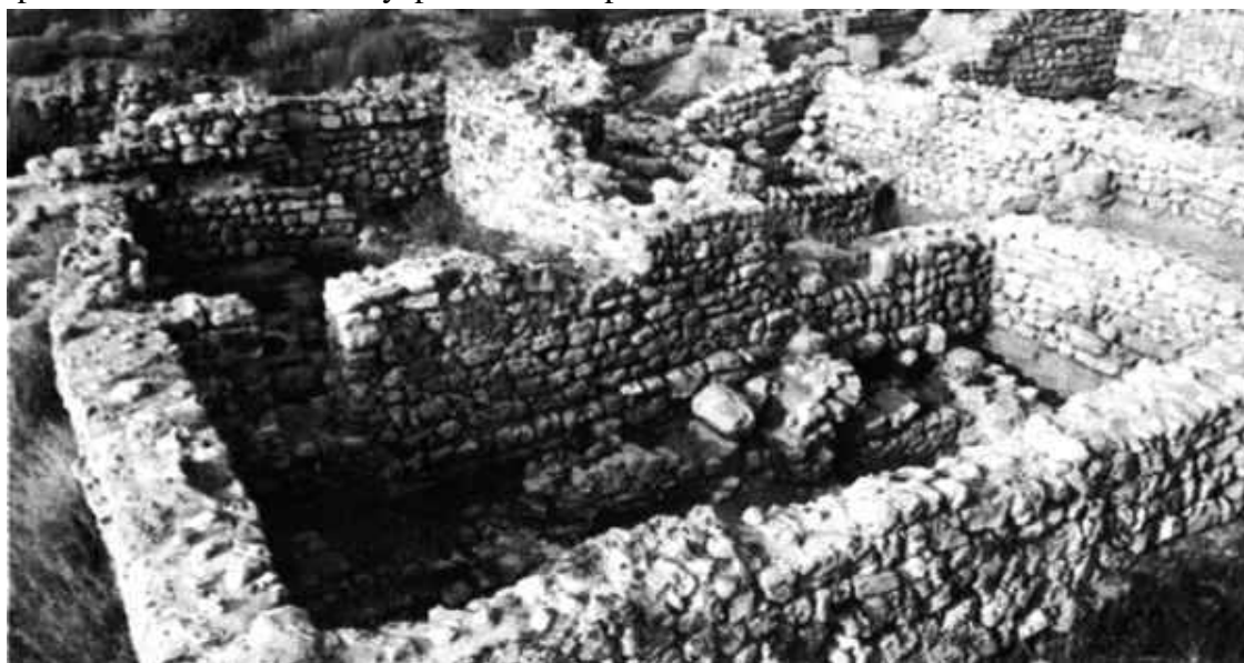
Раскопки жилого квартала в Херсонесе

Херсонес был единственным городом Северного Причерноморья, имевшим регулярную планировку. Оригинальный принцип городской застройки сформулировал зодчий Гипподам из Милета. Гипподамова система предусматривала деление города на приблизительно равные кварталы, образованные продольными и поперечными улицами, которые пересекались под прямым углом. Изначальная планировка Херсонеса была настолько удачной, что ее основы не нарушались полторы тысячи лет, а переустройства ограничивались внутриквартальным пространством. На улицах сохранились плиты древнейшего мощения. На пересечении улиц некогда стояли изваяния. По остаткам жилых построек можно судить о размахе строительства в пору расцвета города. Высокие просторные дома граждан Херсонеса оборудовались подвалами и непременно дополнялись внутренними дворами.