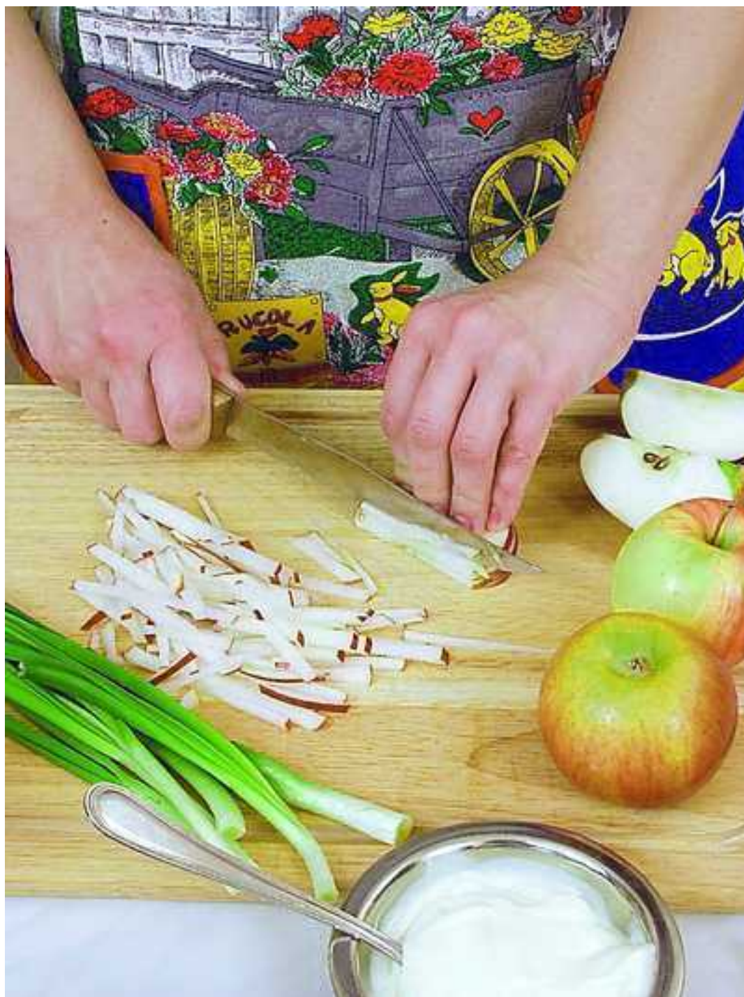
Красное яблоко, не очищая от кожицы, нарезать соломкой.