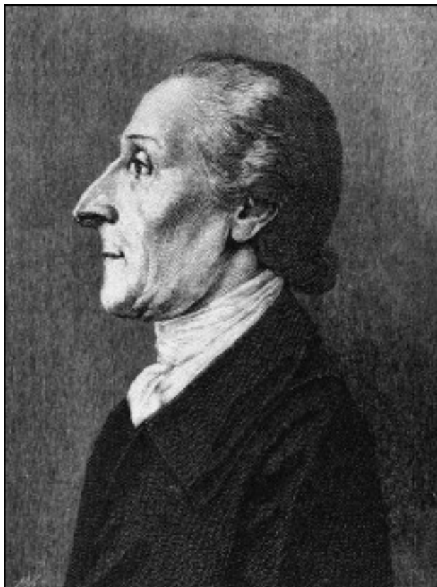
Иоганн Каспар Лафатер

У него были три дочери-погодки: старшей – 16, средней – 15, младшей – 14 лет. Однажды зимним вечером вместе со своей матерью они отправились на бал, в дом, хорошо им знакомый. Его хозяйкой была приятельница их семьи. Гретри приехал туда с опозданием, после репетиции его оперы «Рауль Синяя борода». Эту оперу ставил театр «Комеди Итальянн».