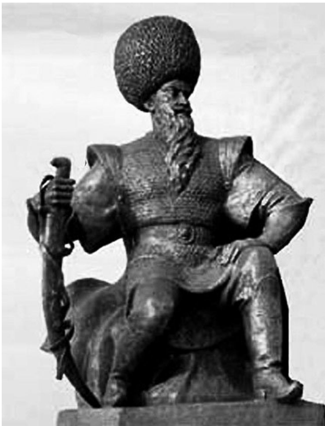
Сельджукский султан Алп-Арслан. Современная скульптура

Сельджукский султан, умевший извлекать уроки из поражений в войнах с Византией и пленивший базилевса Романа Диогена