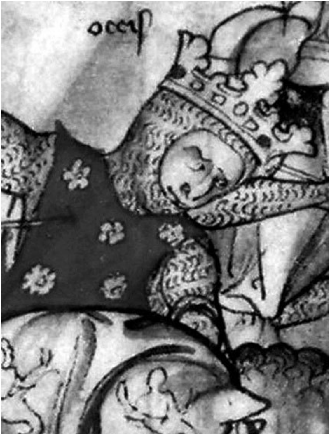
Гибель норвежского короля Харальда III Сурового в битве при Стамфорд-Бридже. Миниатюра из рукописной книги «Жизнь короля Эдуарда Исповедника». Библиотека Кембриджского университета

Последний полулегендарный герой-викинг, ставший королем Норвегии и мужем дочери Ярослава Мудрого, завоевавший Сицилию и Данию