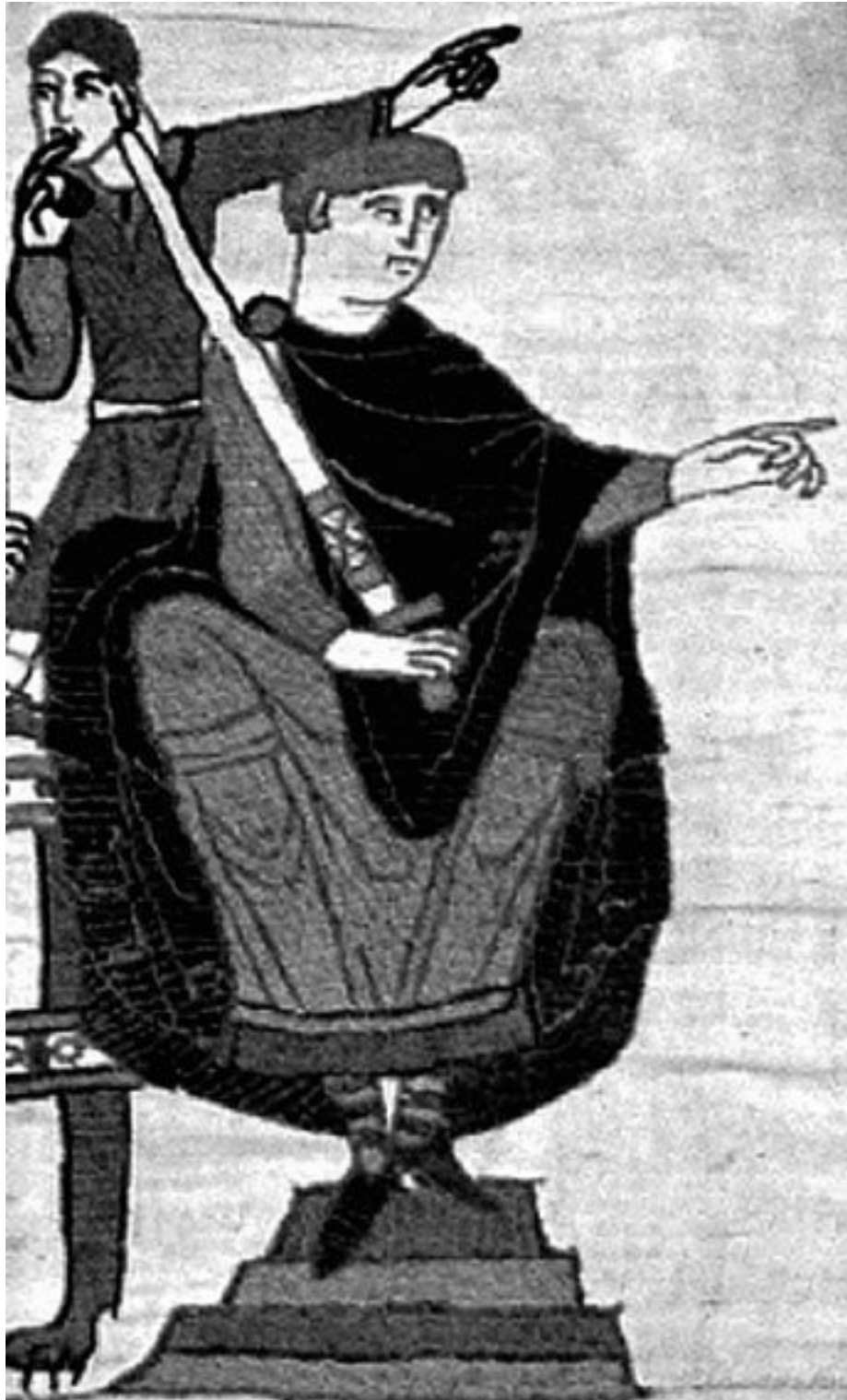
Вильгельм I Завоеватель. Фрагмент ковра из Байё

Герцог Нормандии, с юности мечтавший о королевской короне Англии и добившийся ее мечом