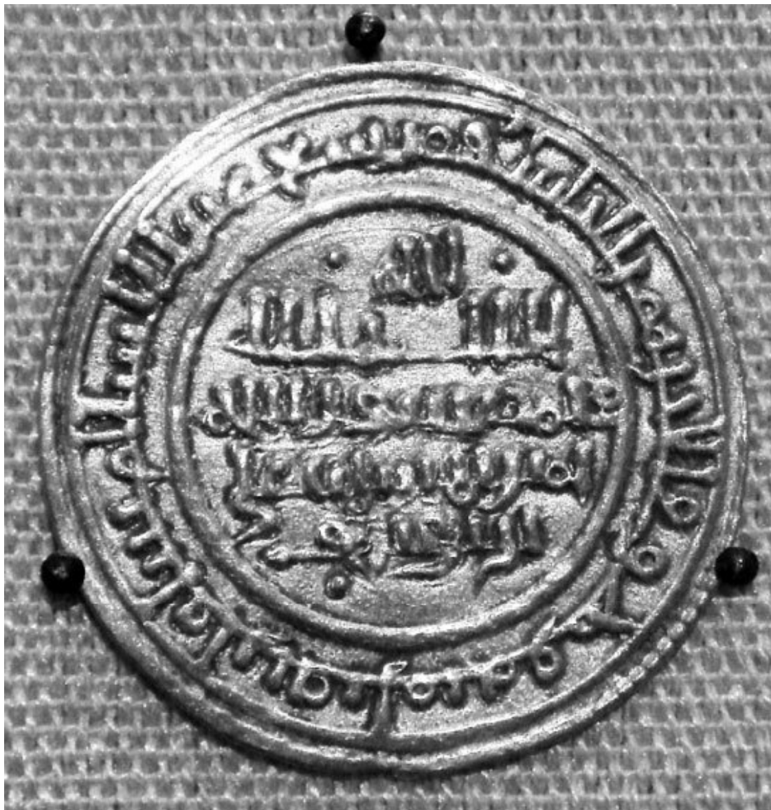
Монета периода правления Абу-Бекра

Военный вождь арабов-альморавидов, прославивший себя разграблением «страны Ганы, в которой золото растет как морковь»