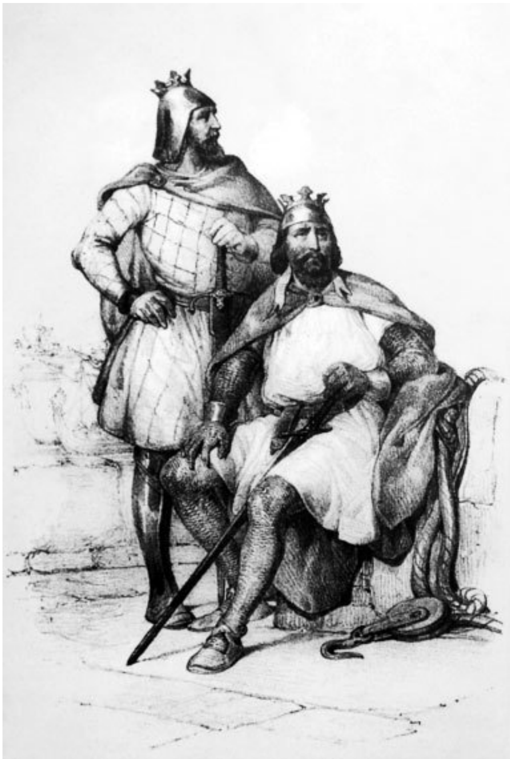
Роберт Гвискар (стоит) и его брат Рожер Сицилийский. Рисунок XIX в.

Предводитель норманнских рыцарей, разбивший в Южной Италии армию римского папы Льва IX и изгнавший арабов из Сицилии