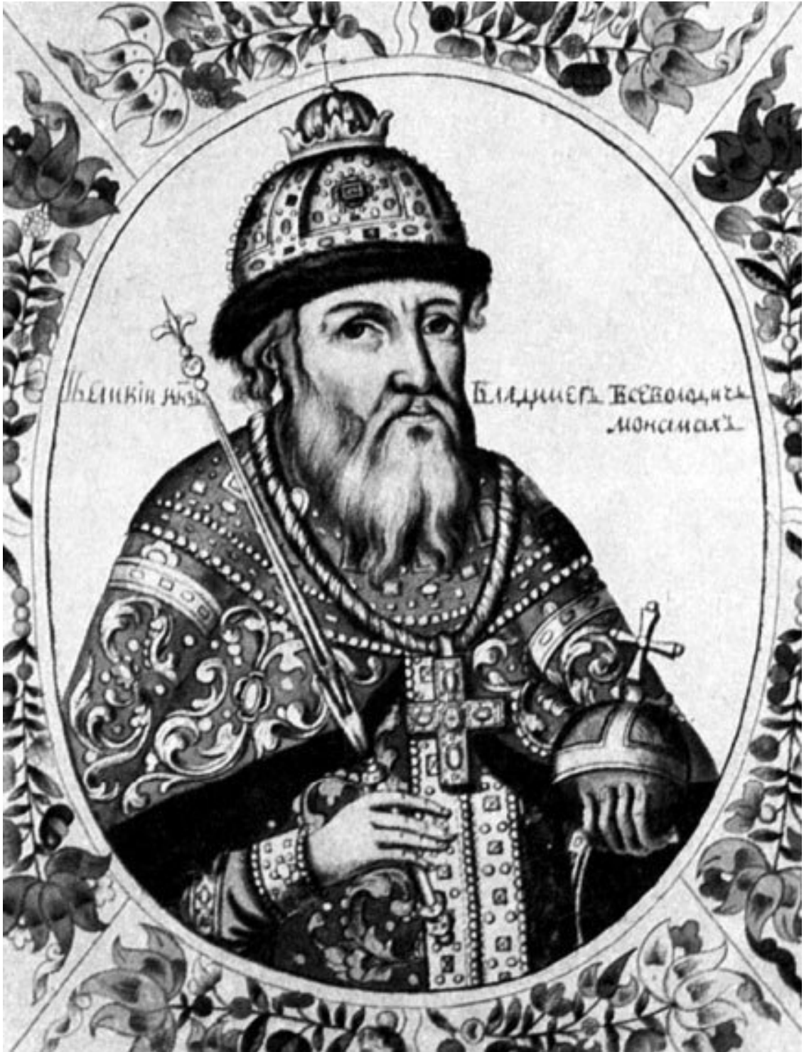
Владимир Мономах. Иллюстрация из «Титулярника»

Победитель «злокозненных» для Руси кочевых орд половецкого народа, изгнавший его из просторов Дикого поля