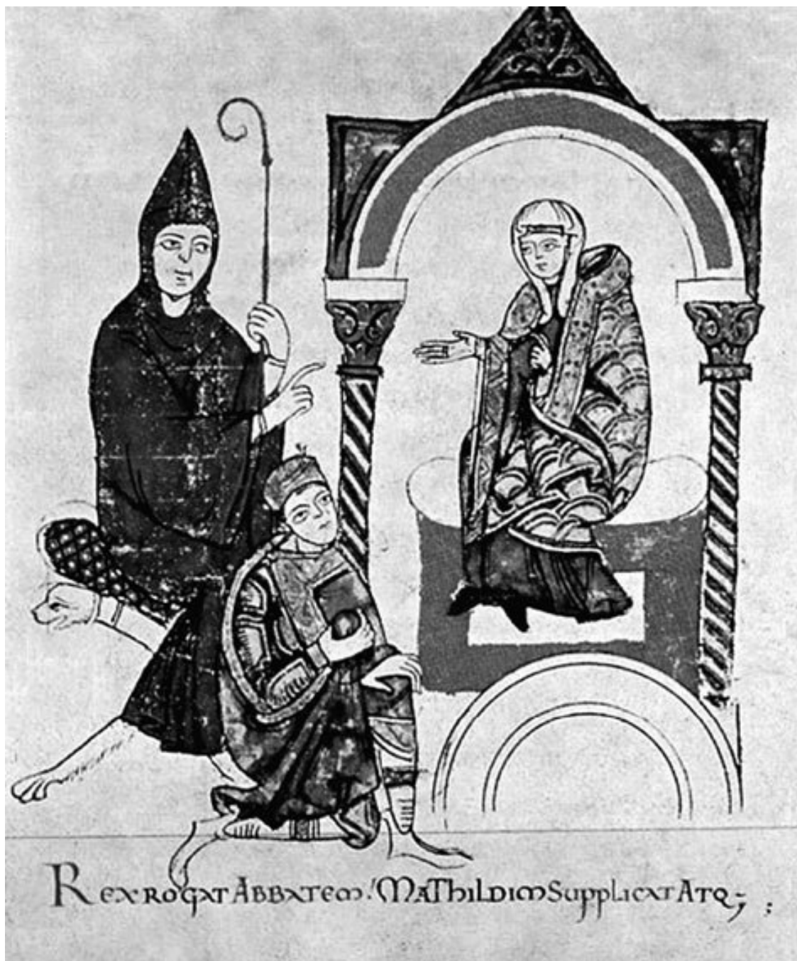
Генрих IV обращается к Матильде Тосканской и Гуго Клунийскому за помощью. Старинная миниатюра

Непокорный Риму германский король, победивший мятежных феодалов, дважды отлучен папой римским от церкви, которого однажды изгнал из Вечного города