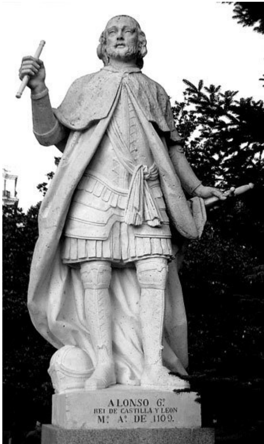
Король Кастилии Альфонс VI. Скульптур Ф. Дель Корраль. XVIII в.

Беглец, ставший королем Кастилии, Леона и Галисии, отвоевавший у мавров (арабов) большую часть Пиренеев