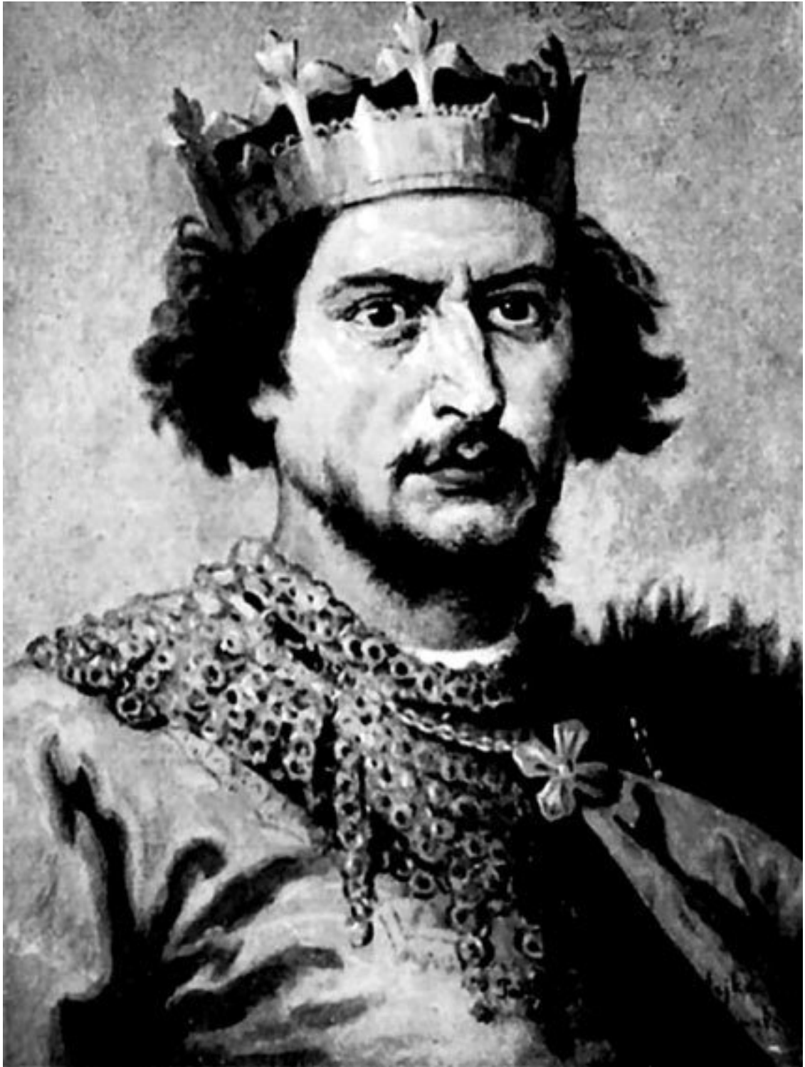
Болеслав II Смелый. Художник Я. Матейко

Воинственный монарх, стремившийся силой оружия расширить владения польской короны не без подсказки Папской курии