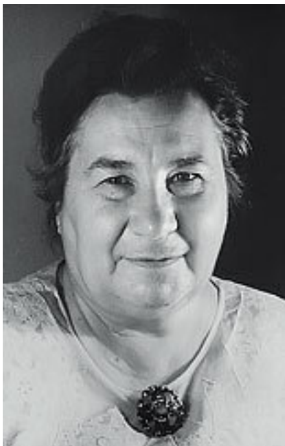
Любовь Воронкова (1906–1976)