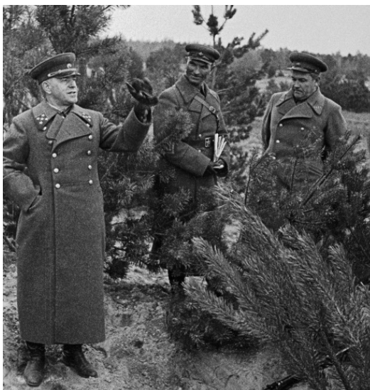
Жуков (первый слева) в дни блокады Ленинграда

В войсках шок от этого приказа был настолько велик, что Политуправление Балтийского флота пошло на беспрецедентный шаг. Было решено все-таки смягчить распоряжение Жукова: расстреливать по возвращении только тех, кто сдавался в плен, а семьи не трогать. Чудовищность этого документа поразила даже Сталина.